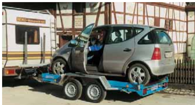
U 2002 mit Zubehör: Alu-Auffharrampen in einer Halterung unter der Ladefläche einschiebbar. Transportsicherung durch Excenterklemmverschluss, dadurch ist ein absolut geräuschfreier Transport gewährleistet.