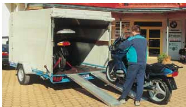
U 1801 mit Zubehör: Dachgestell und Plane, Ladehöhe 1650 mm. Mit Motorradtransportausrüstung können auch Fahrschulmotorräder bequem transportiert werden. Durch die Breite des Anhängers können auch zwei große BMW Motorräder verladen werden. Als Fahrschulanhänger bestens geeignet.