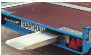
Aluminium-Auffharrampen in einer Halterung unter der Ladefläche einschiebbar, griffige Lauffläche, seitlicher Schutzrand, kein Abrutschen durch Bolzenarretierung.