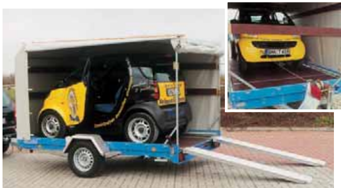
U 1801 mit Zubehör: Dachgestell und PVC-Plane, 1650 mm Ladehöhe, windschnittig vorne abgeschrägt. Plane serienmäßig in hellgrau, andere Planenfarben und Werbebeschriftung auf Wunsch möglich. Zur Verladung, wenn man nicht hinauffahren will, Seilwinde mit Windenbock auf der V-Deichsel montiert.