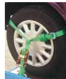
Rad-Sicherungsgurt: Ein Rundgurt wird über das Rad gestülpt und mit einer Ratsche nach unten gespannt.