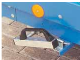
Transportsicherung für Auffharrampen durch Excenterklemmverschluss, absolut geräuschfreier Transport.