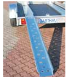
Auffahrschienen rutschfest durch Lochprägung.

Stand- und Auffahrschienen sind generell Zubehör.