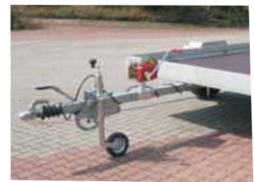
Zubehör lange Vierkant-Rohrbremse mit Seilwinde 900kg.

QM 1001 mit Zubehör Aluminium-Bordwände 300mm hoch, sowie Rohrstützen und ein Satz Lastenträger zur Montage von Fahrradträgern oder Bootsträgern.