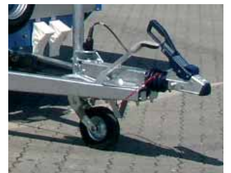
Sicherheits-Anhängekupplung (auf die Kupplungskugel wirkende Beläge unterdrücken Pendelbewegungen während der Fahrt). Für Anhänger bis 3000 kg Gesamtgewicht (gegen Mehrpreis).

<< Zurrstreifen können beliebig viele und auf jede Höhe montiert werden >>