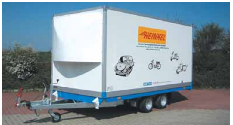
CH 2702 mit Zubehör: Sonderhöhe von 1850 mm Innenhöhe. Für energiespar-sames Fahren Spoiler vorne an der Wand montiert, mit einer Wölbung von etwa 300 mm. Außerdem hat dieser Hochlader eine Sicherheitskupplung an der V-Deichsel montiert und Stoßdämpfer für ruhiges und sicheres Fahren. Als Tandemfahrzeug ist er serienmäßig mit einem schweren Stützrad ausgestattet.