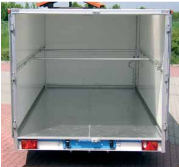
Zubehör: Boden mit 1,5 mm Alublech belegt. Zusätzlich wurden beidseitig seitlich 1 m über den Anhängerboden noch Zurrstreifen für TOPZURR24 montiert. In dieser Zurrstreifen können Nockenfitting oder Absperrstangen eingehängt werden.