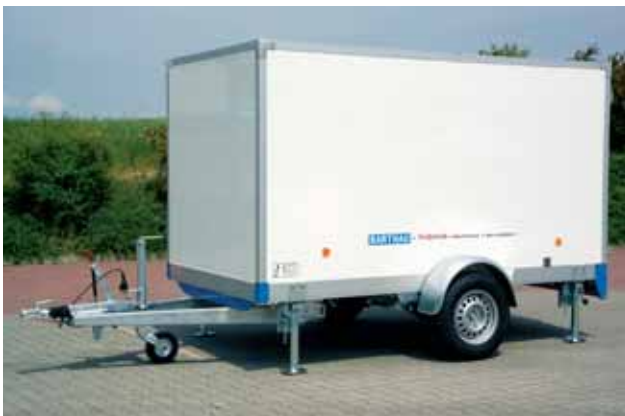
CT 1351 mit Zubehör: 4 Stk. Klappkurbelstützen mit fest angebauter Kurbel hinten und vorne montiert.