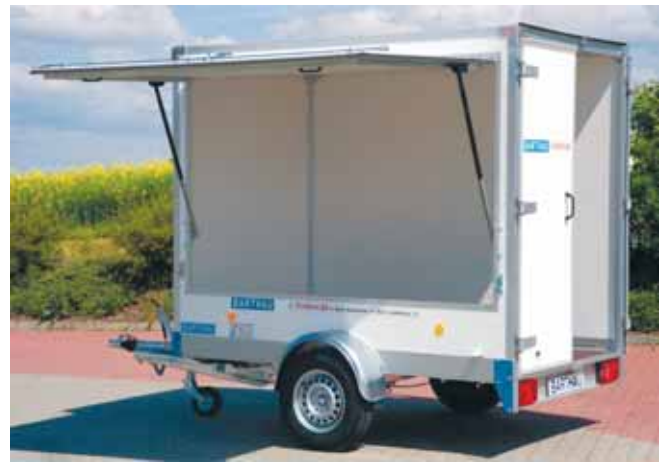
CT 1801 mit Sonderwunsch: Verkaufsklappe links mit großen stabilen Gasfedern und Feststeller, Brüstung 500mm hoch. Serienmäßig von innen verriegelt oder gegen Mehrpreis mit Drehstangenverschuß von außen abschliessbar.