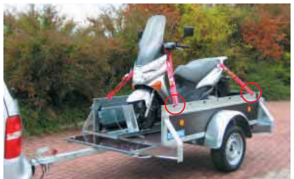
Motorradtransportsatz mit 1 Standschiene und 1 Auffahrschiene, 4 Gurte, 4 Anbringeringe 10x65 im Anhänger montiert. (Bei Anhängerlänge bis 2210 mm nur mit geöffneter vorderer Klappe möglich.)