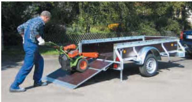
PK mit Zubehör Laderampe gesteckt.

Die Laderampe ist die sicherste Möglichkeit Waren oder Maschinen auf Rädern in einen Anhänger zu befördern.