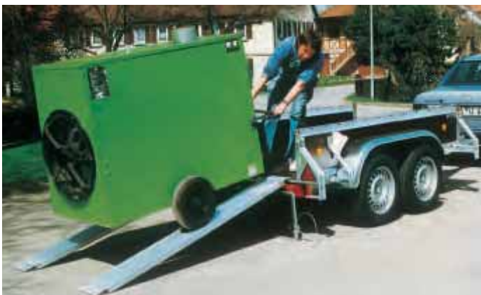
PK 2702 befahrbar durch Alu-Auffahrampen Typ RL 2000 mm lang, 220 mm breit, Tragkraft lt. Prospekt Nr. 0.2. Die Alu-Auffahrampen werden lose in den Anhänger gelegt und können für alle Anhänger verwendet werden.