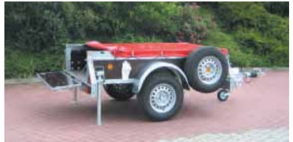
PK 1001 mit vorderer Klappe serienmäßig und Vierkant-Rohrbremse sowie Stützrad leicht. Zusätzlich mit Zubehör: Rohrstützen mit doppelter Klemmhalterung, Ersatzrad mit Halterung und PVC-Plane flach gespannt in Sonderfarbe RAL3000 feuerrot. Die Heckklappe gerade gestellt ist serienmäßig.

Dachgestell und PVC-Plane für Typ PK sind in der Ausführung vorne gerade aber mit Giebedach und in vorne abgeschrägter Form mit ebenem Dach lieferbar. Die Einteilung kann der Preisliste entnommen werden. Die Planenbefestigung ist generell mit einem dicken, dauerelastischen Expanderseil , das an Befestigungsknöpfen an der Bordwand eingehängt wird. Die Gurtleiste wird von der Plane überdeckt und kann für Transportbefestigung weiterhin benutzt werden. Vorne und hinten sind generell Einsteckbretter montiert. Beim Giebedach sind seitlich gekantete Bleche eingeschraubt, das abgeschrägte Dach ist generell mit Vierkantrohren verschraubt. Bei Laderampe steckbar reicht der hintere Giebel bis zur Bordwand, so dass auch ohne Laderampe gefahren werden kann. Bei PKL hat die Plane hinten einen Ausschnitt.