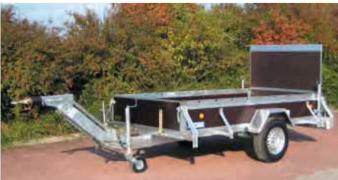
Typ PK mit höhenverstellbarer Auflaufbremse mit DIN-Zugöse für LKW. Verstellbar von 400 mm bis 1100 mm Anhängöhe. Vordere Klappe nur abnehmbar nicht umklappbar. Zu Kugelkupplung wechselbar gegen Mehrpreis. Ausserdem Zubehör: Alu-Riffelblech-Kotflügel, Laderampe.