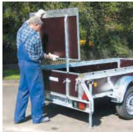
Laderampe leicht zu entfernen.