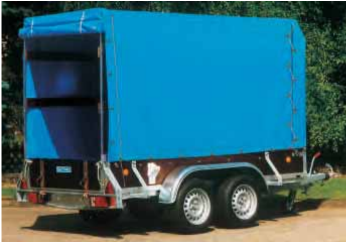
PK 2002 mit Zubehör Dachgestell und PVC-Plane 1600 mm. Dies entspricht einer Ladehöhe von 2000 mm. Diese Plane ist in der Sonderfarbe RAL 5015 himmelblau .

Dachgestell und PVC-Plane für Typ PK sind in der Ausführung vorne gerade aber mit Giebedach und in vorne abgeschrägter Form mit ebenem Dach lieferbar. Die Einteilung kann der Preisliste entnommen werden. Die Planenbefestigung ist generell mit einem dicken, dauerelastischen Expanderseil , das an Befestigungsknöpfen an der Bordwand eingehängt wird. Die Gurtleiste wird von der Plane überdeckt und kann für Transportbefestigung weiterhin benutzt werden. Vorne und hinten sind generell Einsteckbretter montiert. Beim Giebedach sind seitlich gekantete Bleche eingeschraubt, das abgeschrägte Dach ist generell mit Vierkantrohren verschraubt. Bei Laderampe steckbar reicht der hintere Giebel bis zur Bordwand, so dass auch ohne Laderampe gefahren werden kann. Bei PKL hat die Plane hinten einen Ausschnitt.