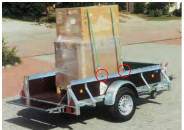
PK 1351 mit serienmäßiger Gurtleiste. Auch hohe Ladung kann hier sicher verzurrt werden. Hintere Klappe mit Seil gerade zu stellen serienmäßig. Die Klappe kann für die Verladung mit Stapler auch ganz abgenommen werden.