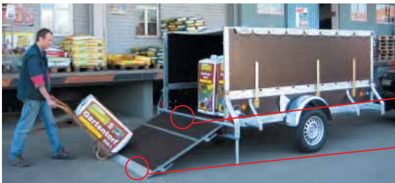
PK mit Zubehör Laderampe gesteckt, Aufsätze 800 mm hoch, Flachplane.

Die Rampe ist zweiteilig gesteckt, das Unterteil ist 400 mm und das Aufsteckteil 800 mm hoch. Die Scharniere der Laderampe sind verstärkt. Die Tragkraft ist max. 1000 kg bei einem Radstand von mind. 1250 mm. Bei geringerem Radstand ist die Tragkraft entsprechend weniger. Das Rohrscharnier ist vollkommen geschlossen und kann ohne Widerstand auch mit kleinsten Rollen überfahren werden.